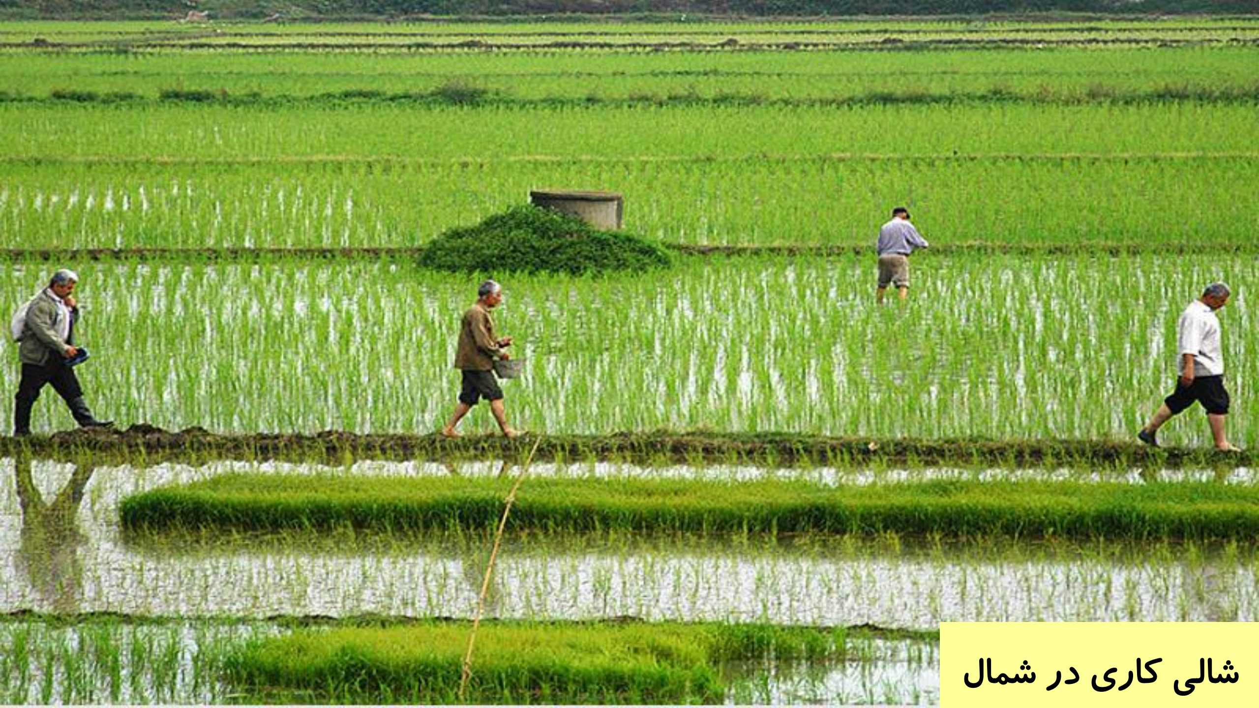
شالی کاری در شمال