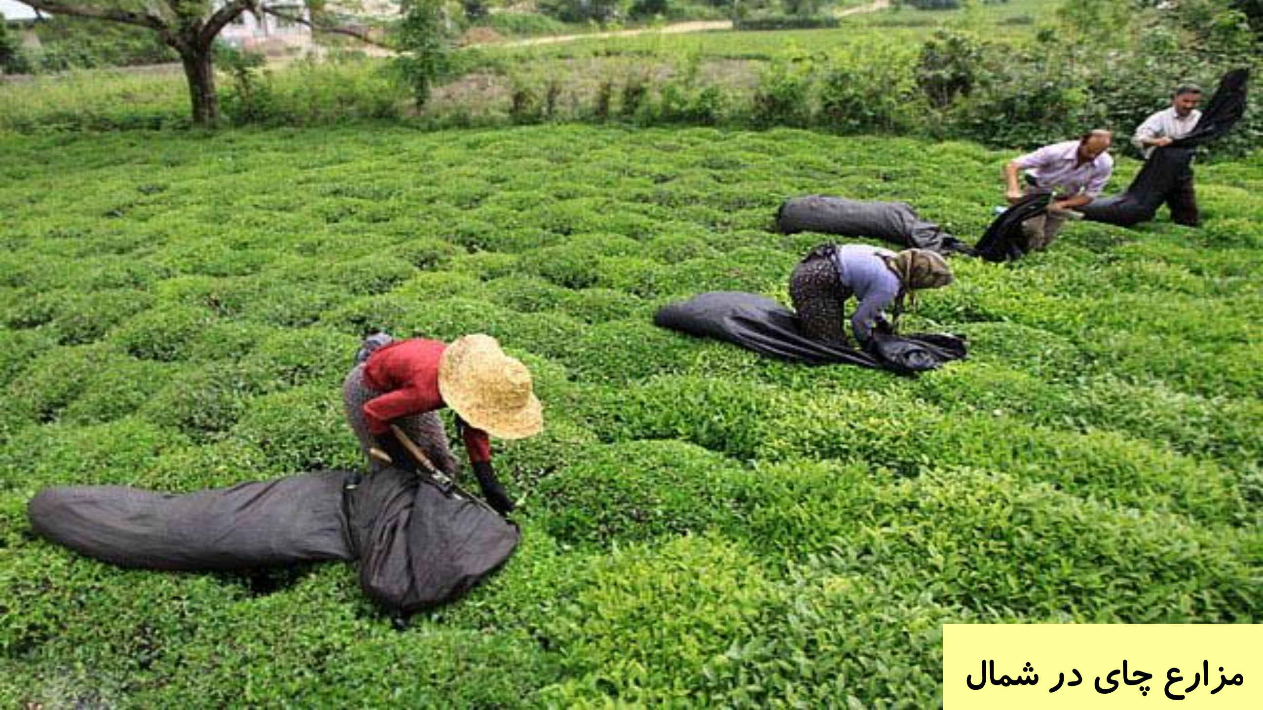
مزارع چای در شمال