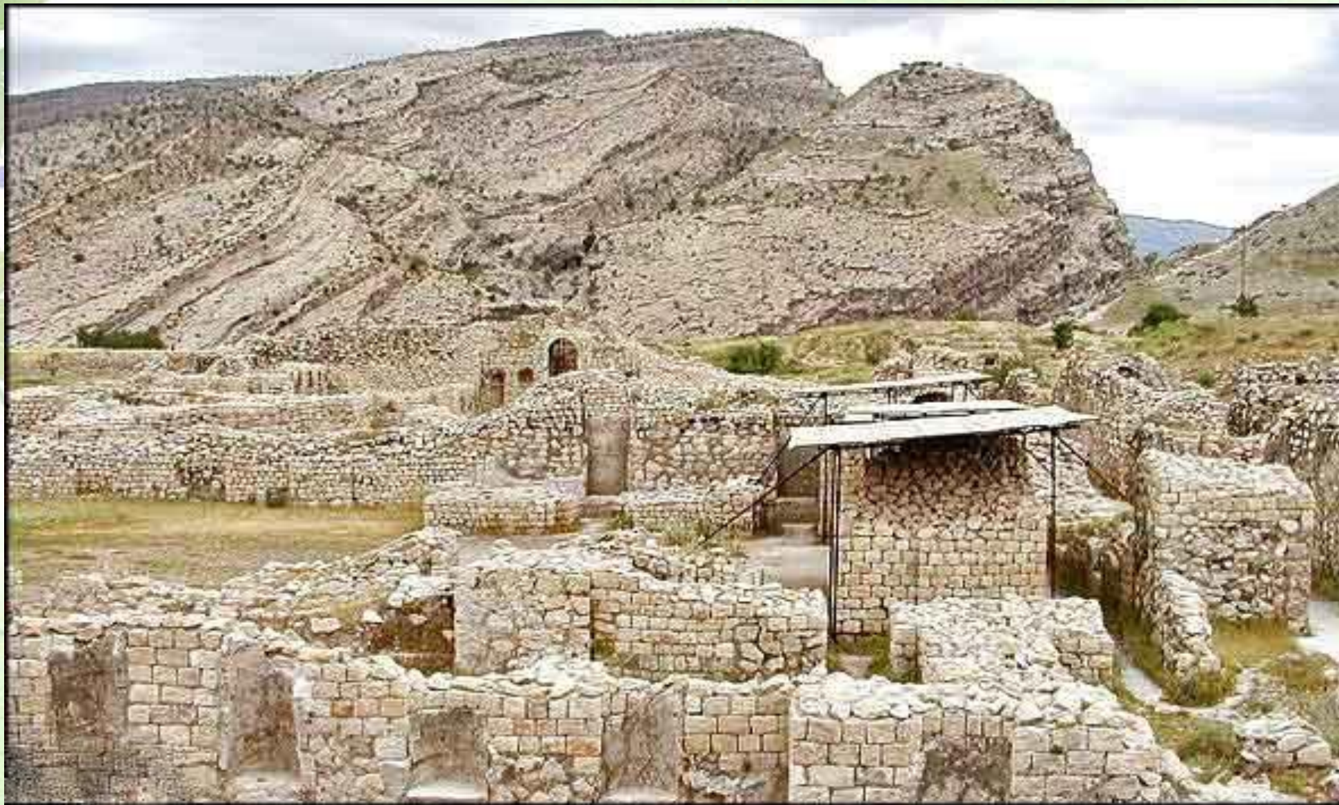
بقایای شهر بیشابور در نزدیکی کازرون