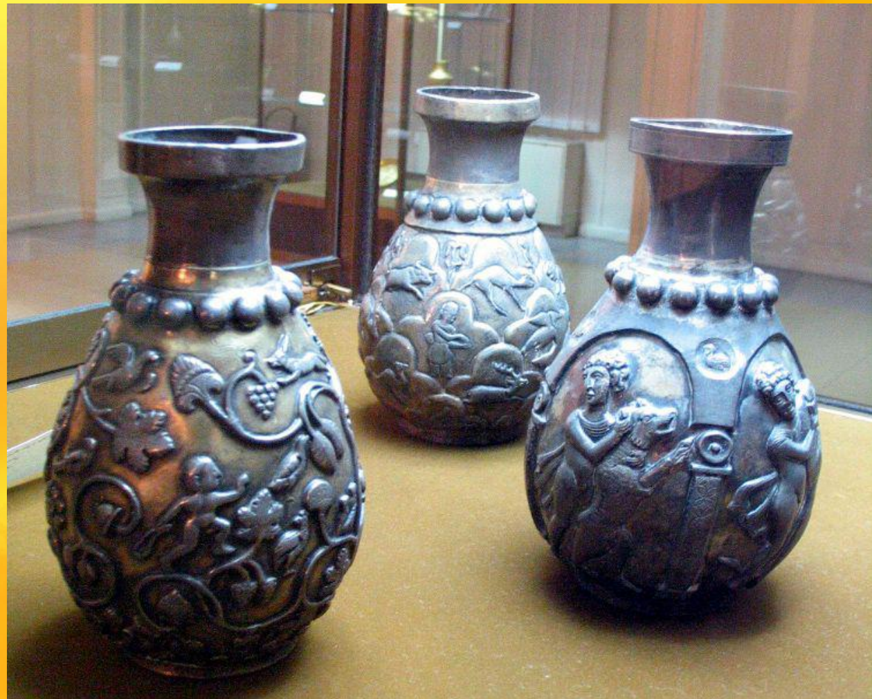
گلدان نقره و طلاکوب