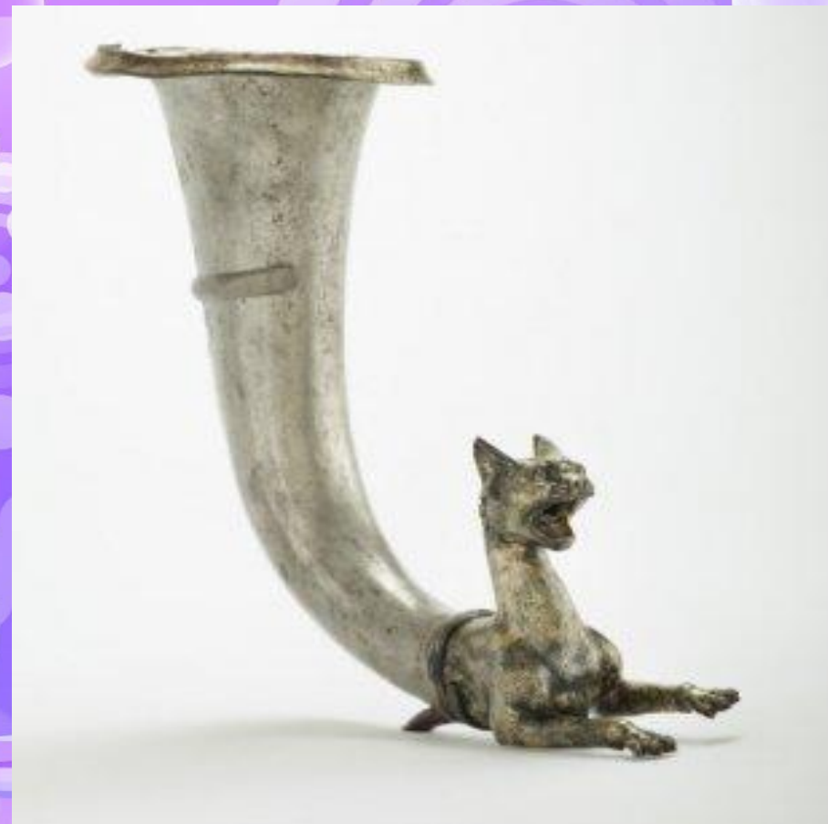
ریتون نقره ای