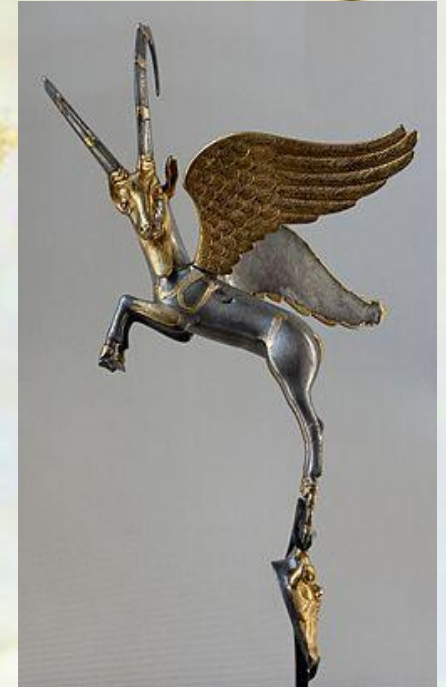
دسته گلدان بز طلایی