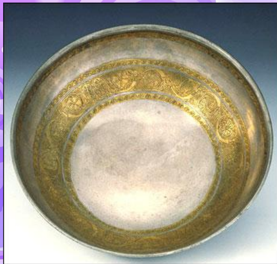
ظرفی از نقره و طلا