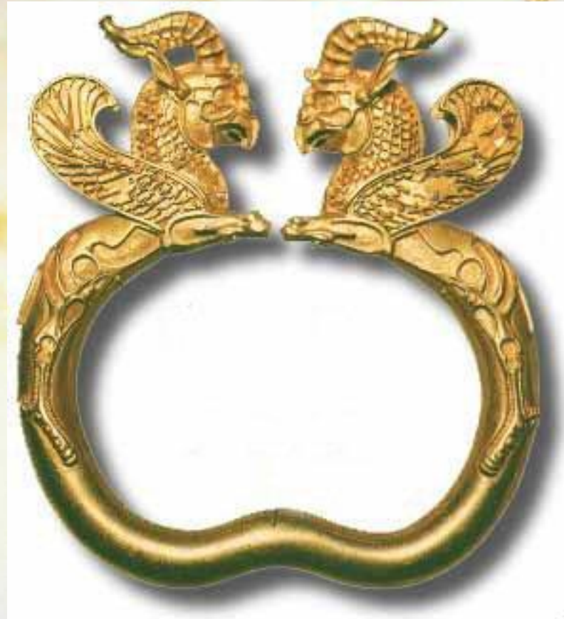
بازوبند طلائی بز و پرنده هما