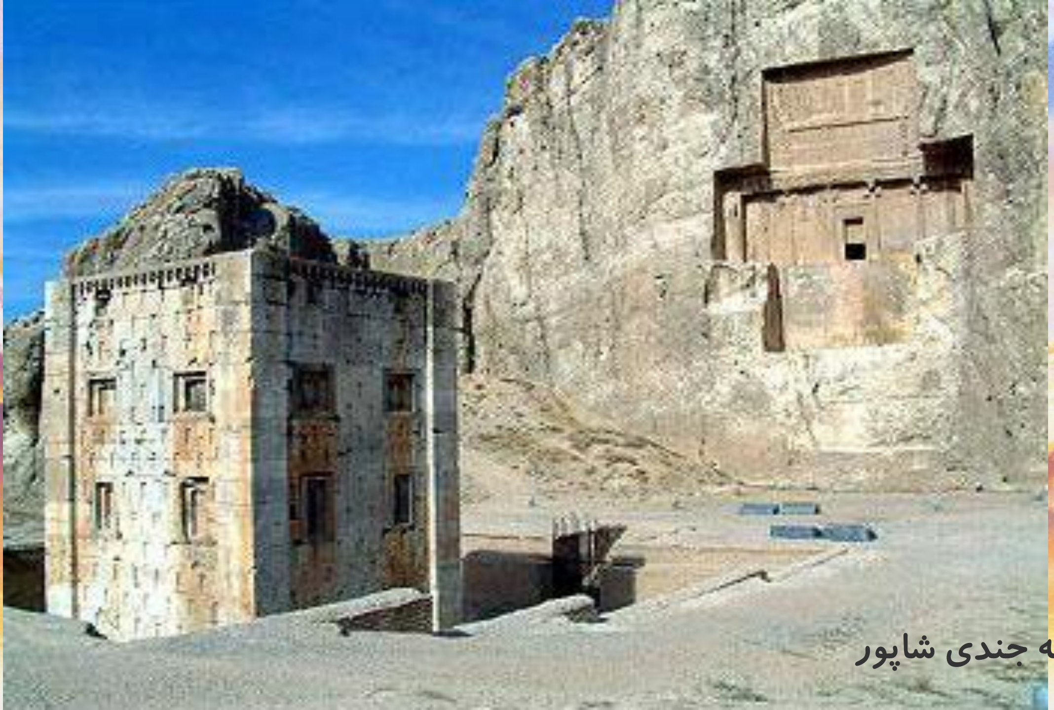
مدرسه جندی شاپور