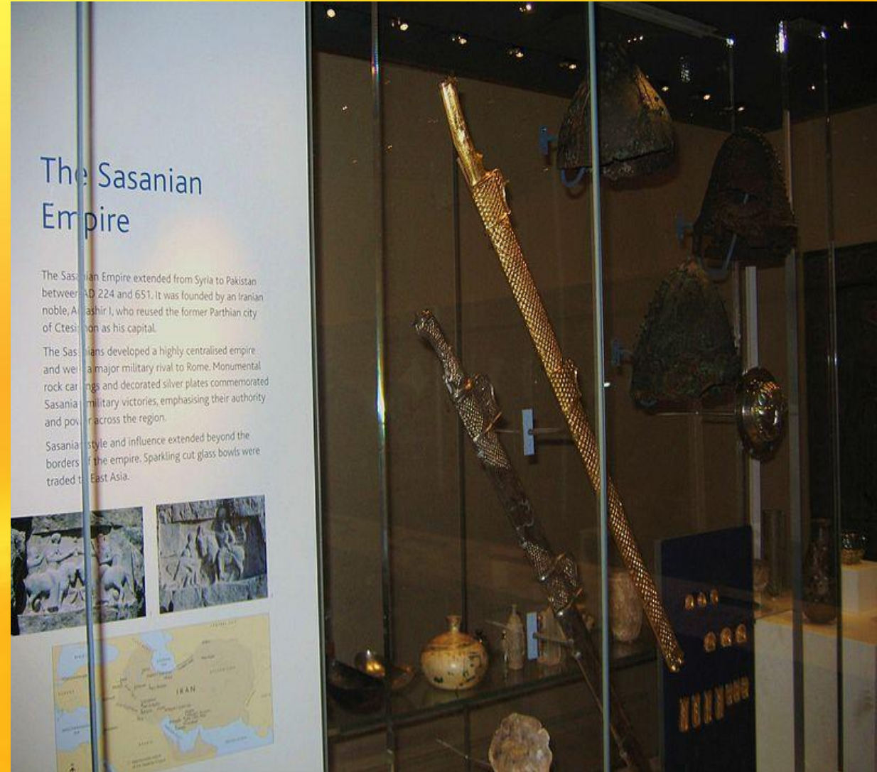
شمشیر طلای اردشیر بابکان، موزه لندن