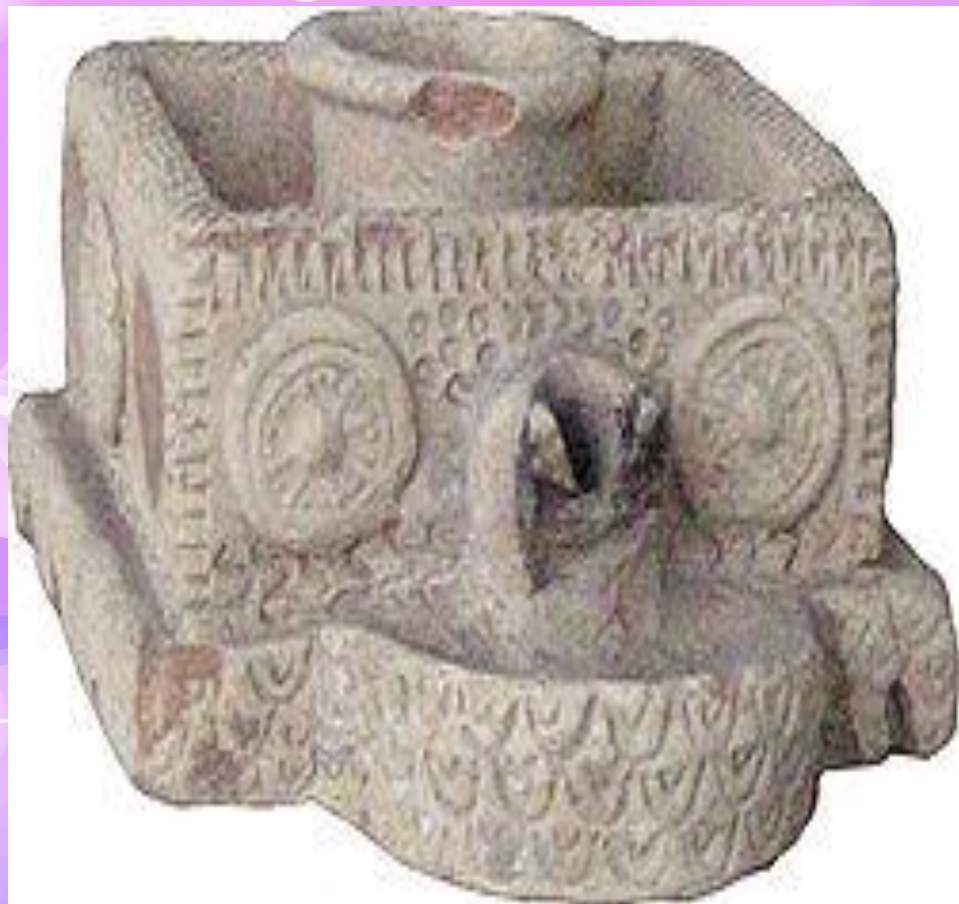
چراغ روغن سوز سرامیکی