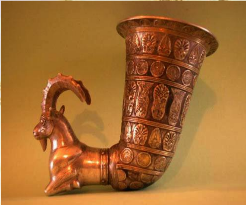
ریتون طلایی بز کوهی