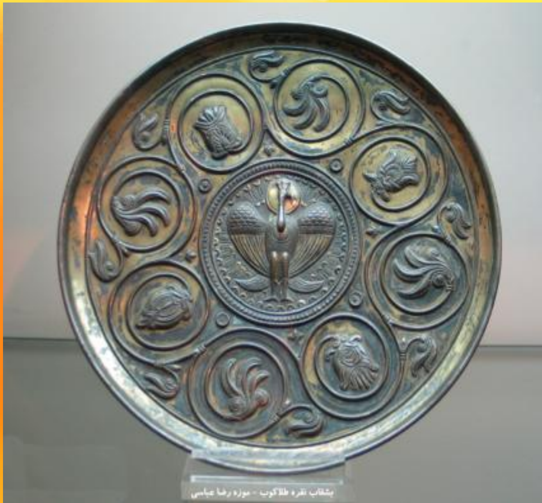
بشقاب نقره و طلاکوب