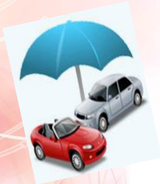
بیمه سرنشین خودرو