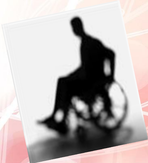
بیمه از کارافتادگی