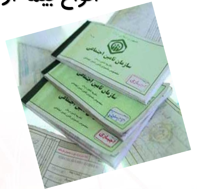
بیمه بهداشت و درمان