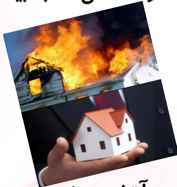
بیمه آتش سوزی